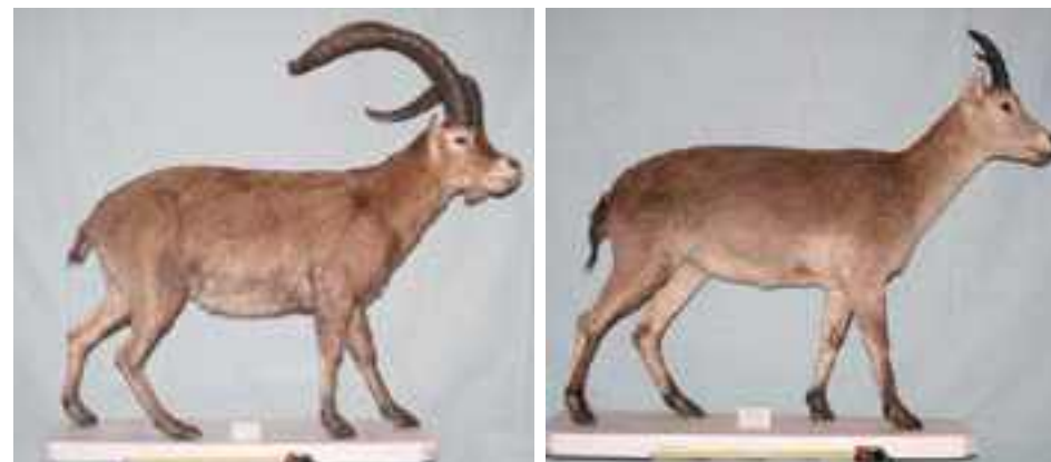
El macho y la hembra de bucardo de Bordeaux