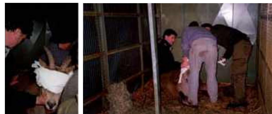
La última bucarda, capturada el día 20 de abril de 1999, fue puesta en libertad de nuevo con un collar de transmisión

Sigue la esperanza de que la última hembra se quedaría embarazada. En el siguiente periodo reproductor, 1997-1998, el macho que ha pasado el verano abajo en el valle, cerca del río, vuelve a cotas superiores y encuentra a la hembra bucardo. Se junta con ella y vuelve a su