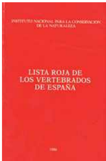
ICONA publica la primera Lista Roja de España en el año 1986 (97)

¿Pueden cambiar las obligaciones ante la Comunidad Europea la actitud pasiva de las administraciones españolas en una activa y salvar al bucardo de la extinción?