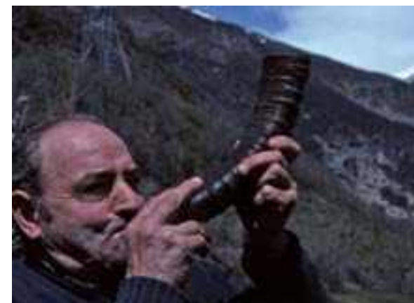
El sonido que producían los cuernos de bucardo se escuchaba por todo el pueblo de Torla

“En mis tiempos de estudiante de Veterinaria subí muchas veces a Ordesa para ver el bucardo. Solo lo he visto una vez, cerca de un comedero” me contó Javier Lucientes. Él no se acuerda bien cuándo era, sería allí por el año 1978. Javier es conocido como