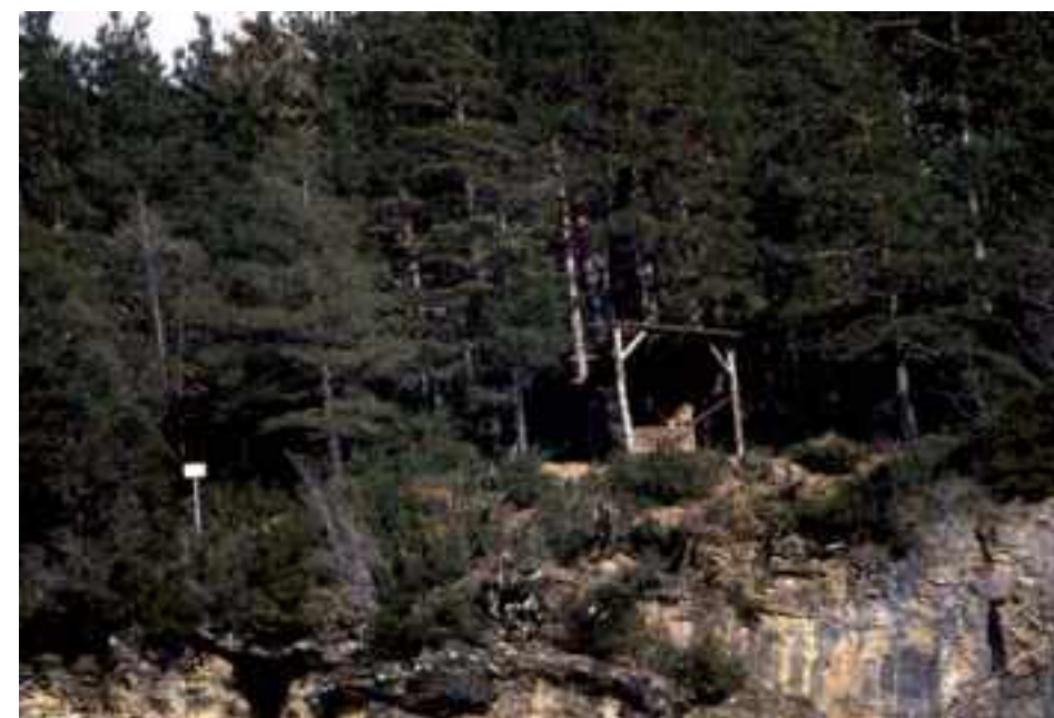
Dos bucardos atendiendo un comedero

Un dato interesante es que nunca se han visto bucardos en las cacerías de sarrios. El bucardo se esconde enseguida cuando nota algún ruido extraño. Se mete en alguna cueva donde nadie lo puede ver. Esto explicaría por qué el regimiento que puso en marcha Félix Rodríguez de la Fuente en el valle de Ordesa solo vio fugazmente uno o dos bucardos. Es otra de las historias extrañas que rodean al bucardo. Rodríguez de la Fuente ya era famoso y venía al Pirineo de Huesca a filmar el quebrantahuesos en el año 1977. Para saber si había posibilidad de filmar al deseado bucardo pusieron a su