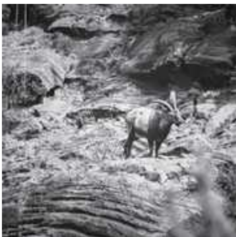
Macho bucardo, siempre atento por si hay algún peligro. Esta foto está colgada en el restaurante de la Pradera de Ordesa

“Tenía que enseñar los bucardos al jefe de la delegación americana que vino al Parque Nacional cuando la ampliación en el año 1982. Se vistió con una chaqueta roja, un