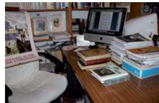
La búsqueda ha resultado en cientos de fotocopias, libros, revistas, cartas...

Una búsqueda solo es completa si se encuentra el escrito original. Para conseguir esto se necesita tiempo e insistir, no darse por vencido. He encontrado artículos extensos, otros eran tan cortos que apenas ocupaban un par de líneas y fueron escritos en francés, inglés, latín, italiano, alemán y español. Al final, he conseguido una buena pila de fotocopias y unos libros antiguos más que interesantes.