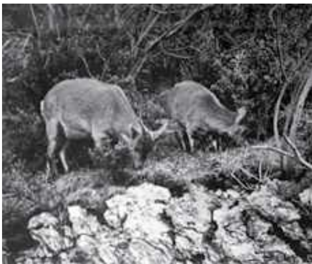
Foto firmada por el autor, de madre y cría de bucardo pastando en Ordesa, colgada en el Centro de Visitantes del Parque Nacional de Ordesa y Monte Perdido en Torla

Igual de extraño que su tono conservacionista es la información especializada del artículo. Relata con autoridad la historia, la situa-