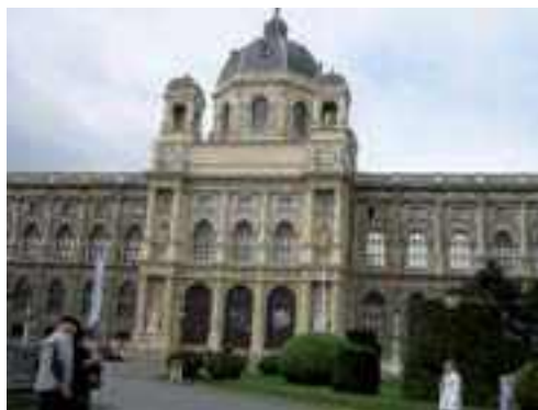
En la sala 36 del Museo de Historia Natural en Viena se exhibe un bucardo procedente del macizo de la Maladeta