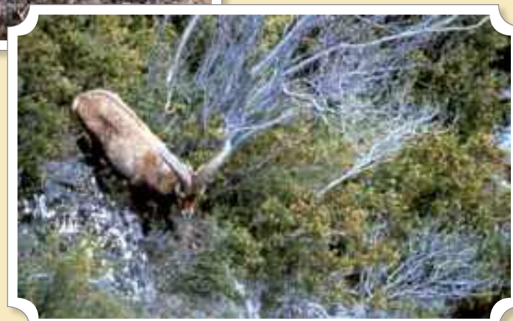
Las fotos de Bernard Clos documentan la vida del bucardo en Ordesa