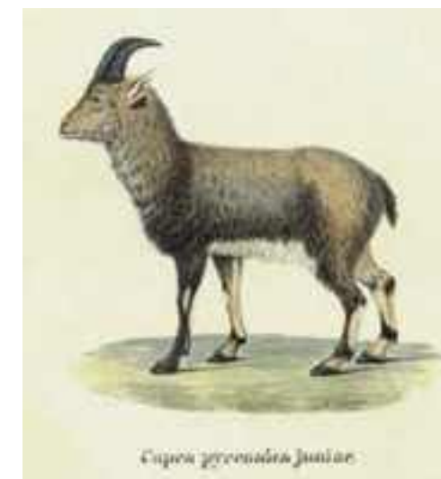
Litografía de cría de bucardo publicada por Schinz en 1838

¿Cómo hicieron estas litografías del bucardo? Schinz escribe que recibió tres dibujos de Bruch (145). La única persona que en aquel momento poseía una hembra era Bruch y hasta el día de hoy la única cría naturalizada también es de él. Estas litografías solo pueden estar basadas en dibujos de estos animales que aún se guardan en Mainz y de las que me enviaron fotografías. La cría naturalizada no tiene las marcas oscuras de la litografía. La única explicación es que el autor, que nunca ha visto el animal, las ha añadido por cuenta propia. Las litografías del