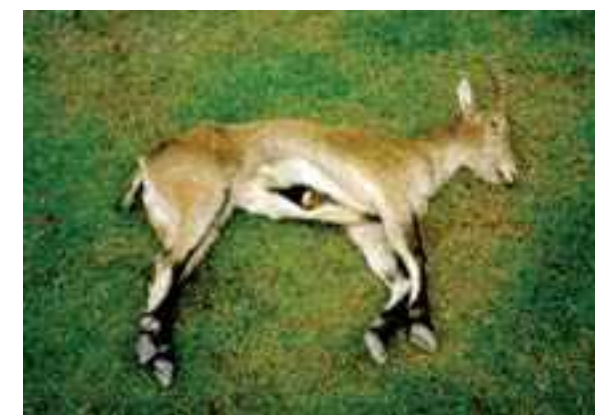
La antepenúltima bucarda fallecida el 16 de octubre de 1996 en el cercado de la Garcipollera

Un paro cardio-respiratorio acabó con la vida de este animal el miércoles 16 de octubre de 1996 a las 11 de la mañana (71). Los principales diagnósticos a raíz de la necropsia fueron: es un animal viejo, con la inmunidad deprimida, con insuficiencia e infección renal y con neumonía bacteriana y parasitaria. Sus problemas intestinales habrán provocado una diarrea crónica, entrando en un círculo del que no se puede salir. La antepenúltima bucarda sufría de pérdida de peso en el último mes, fue tratada y comenzaba a recuperarse, pero murió repentinamente. No había nada que hacer. La necropsia oficial reveló que a la antepenúltima bucarda le había afectado una de las bacterias más comunes ( Clostridium perfringens ) que habita normalmente en el tracto intestinal de las ovejas y otros mamíferos. Generalmente esta bacteria no causa problemas. Un aumento exagerado del número de esta bacteria hace posible que se puedan producir suficientes cantidades letales de toxinas que resultan en la muerte del animal.