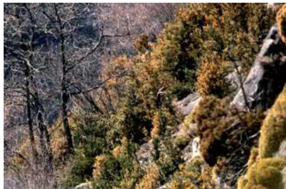
Los bucardos se hacían casi invisibles entre la vegetación. Aquí se observan los cuernos de un macho