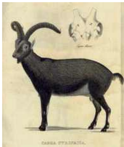
Litografía de macho bucardo publicada por Schinz en 1838

Con este título tan largo (145) Schinz empieza a filosofar sobre el origen de las cabras silvestres, de si se trata de variedades o especies y sobre el porqué de la distribución de las especies en general. Después nombra a las once cabras silvestres que se conocían mundialmente y entre las cuales estaba: