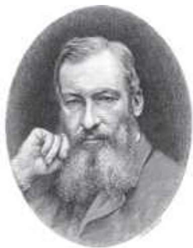
Grabado de Edward North Buxton publicado en su libro Short Stalks

Uno de los hombres más importantes de la colonia inglesa de Pau fue Edward North Buxton (59). Era un organizador nato que acabó siendo un miembro del Parlamento inglés. Sin preocupaciones económicas, establecía sus campamentos de caza en los rincones más salvajes del mundo (30). Llegó a Bujaruelo y a Ordesa con mulos cargados de tiendas de campaña, material de cocina, provisiones, armas de fuego y