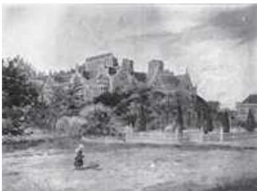
Lilford Hall, la casa de Lord Lilford. Todos los cazadores ingleses vivían en mansiones y poseían enormes propiedades

Lord Lilford era un ornitólogo inglés ya famoso a mediados del siglo XIX y uno de los fundadores de la revista ornitológica Ibis , que aún está entre las mejores de su género. Viajó varias veces a España y estaba en continuo contacto con otros naturalistas de su época. Escribe sobre su visita a Ordesa del 5 de junio de 1867 (58): “El Valle de Ordesa (en Aragón) es tan espléndido que sería absurdo intentar describirlo”. Lord Lilford y sus acompañantes vieron varios bucardos en las montañas de Ordesa pero no de cerca y “nadie realizaba un tiro”.