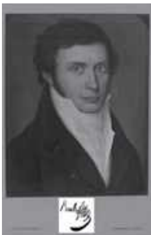
Retrato y firma de Carl Friedrich Bruch

El célebre naturalista alemán Brehm revela en 1844 la verdad sobre la cabra del Pirineo (126). Ya en el año 1835 el primer bucardo llega a Mainz. Bruch ve enseguida la diferencia con el Ibex de los Alpes, diciendo que deberían ser especies diferentes. Encargó más ejemplares y consiguió cinco: dos machos viejos, dos machos jóvenes y una hembra vieja. En la colección de Mainz se conservan hoy en día una familia de bucardos: un macho, una hembra y una cría macho.