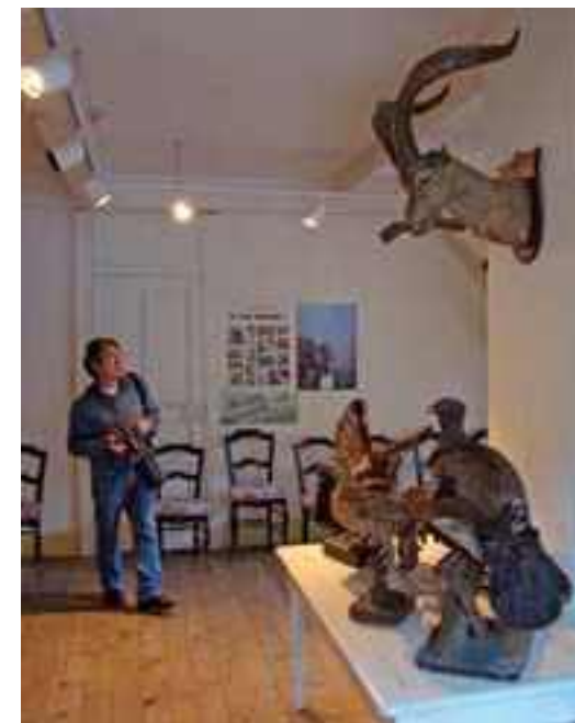
El famoso bucardo de Bagnères-de-Luchon se expone en el Museo Municipal

El mayor Museo de Historia Natural de Europa, el de Londres, cuenta con más de dos millones de piezas. No es de extrañar que aquí se guardan el mayor número de bucardos, siete. Sorprende la ausencia de piezas del cazador Sir Victor Brooke, su gran colección debe haberse perdido. Contacté con la casa donde vivía en Irlanda del Norte, convertida en un museo, pero allí