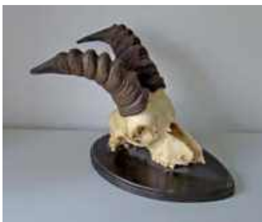
Cuernos de bucardo procedente de Ordesa, año desconocido, de 6 años de edad, que muestran poco crecimiento

El programa LIFE para la conservación del Bucardo había designado a Francia la tarea de resolver el asunto de la taxonomía. ¿Dónde está el bucardo en el reino animal? Con las nuevas técnicas del ADN debería ser posible establecer si el bucardo sería especie o subespecie. Quién mejor que el guarda mayor del Parc National des Pyrénées, especialista en la cabra montés, le Bouquetin ibérique (49), podría ocuparse de esta tarea. “Personalmente he recogido todas las muestras de ADN”, me contó Jean-Paul Crampe. “Del bucardo de los Pirineos llegué a recoger muestras de 15 ejemplares diferentes, tanto de animales de procedencia del macizo de la Maladeta como de Ordesa. Deberías ir a ver los de Bordeaux, son los animales naturalizados más bonitos que he visto”. ¿Y las otras subespecies? Jean-Paul está muy contento de haber ido con guardas de Gredos, de Sierra Nevada, de Cazorla y otros lugares. Todas estas muestras de ADN las envió a un laboratorio para su estudio. Pero esto no resolvió las dudas (113, 131).