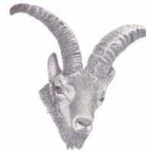
Macho bucardo (Dibujo: Eva Escarrio/bucardo.es)

La supervivencia de una población de animales depende de sus miembros fértiles, de los que van a tener hijos. Si, por alguna razón, desaparece uno de los sexos y solo quedan, por ejemplo, hembras, su final es seguro. Si en un momento solo quedara un macho, todos los hijos en todas la próximas generaciones llevarían los genes de este macho. Esta pérdida genética les haría más vulnerables a enfermedades y a otros factores adversos. Los cazadores Brooke y Buxton relatan de machos y hembras en los años 1878-1885. El siguiente que habla de machos y hembras es el cen-