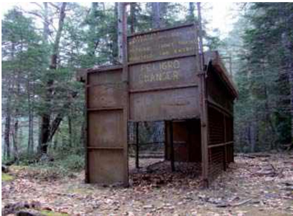
Algunas de las trampas instaladas para el bucardo aún se encuentran en el valle de Ordesa, diciembre de 2009

El objetivo del proyecto era capturar todos los bucardos supervivientes. Por la dificultad del terreno y el comportamiento, se sabía que era una tarea difícil y delicada. Se habían diseñado estas trampas para capturar ungulados vivos e ilesos. Una vez depositados en las laderas del valle, había que encajar las piezas a la perfección. El dispositivo haría que, al entrar un animal, las puertas a ambos lados se cerrarían de golpe. El bucardo capturado se quedaría de repente a oscuras y, por lo tanto, tranquilo. En febrero de 1994, por fin, todo estaba preparado.