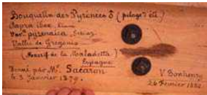
Tabla con inscripción en el Muséum d'histoire naturelle de Toulouse

Otros lugares guardan restos de bucardo en los almacenes de sus museos. En Mainz (Alemania) quedan tres de los bucardos de la colección del notario C. F. Bruch. Los