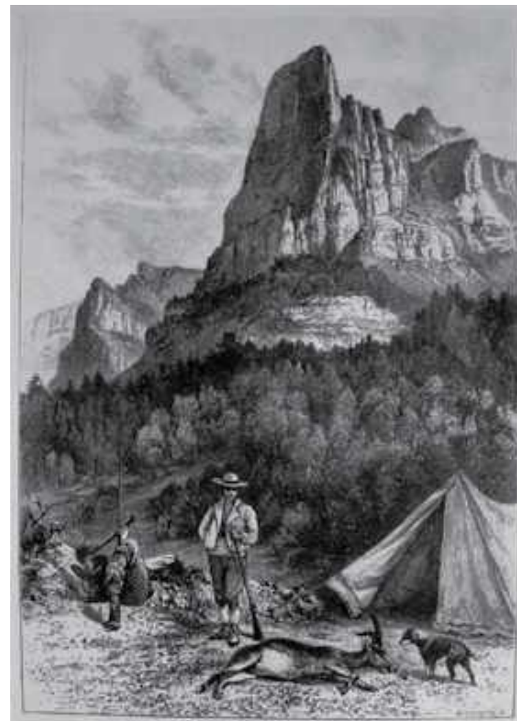
Una escena de caza del bucardo en Ordesa publicada por E. N. Buxton en 1893. Observa el cadáver de la hembra bucardo, el perro, la escopeta y el catalejo

Buxton es la persona que en 1881 pagó las clavijas de Cotatuero que todavía sirven para desplazarse con más facilidad desde el fondo del valle hacia las zonas altas de Ordesa. Le costó viajar hasta Ordesa cuatro veces para abatir a “uno de aquellos espectaculares machos”. Para ahorrar tiempo, encargó al herrero de Torla las clavijas. Ahora podían subir hacia la Brecha de Rolando por Cotatuero y no estaban obligados a subir por el paso de Salarons.