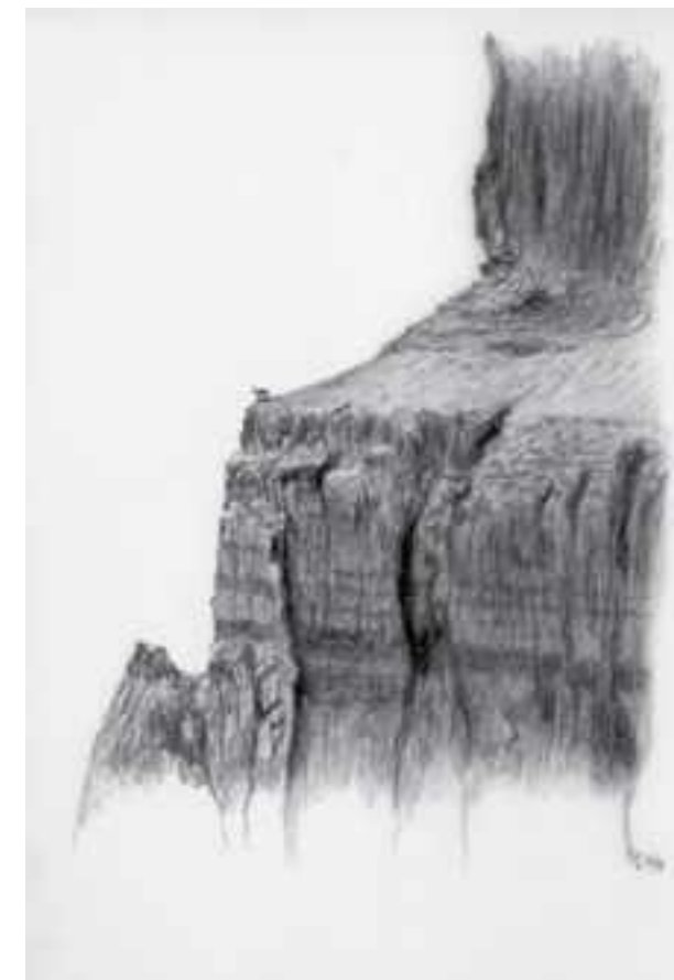
Un bucardo en una faja de Ordesa (Dibujo: Georges González)

Ahora nos queda encontrar las verdaderas causas de la extinción del bucardo. En todo tipo de escritos, de expertos y no tan expertos, de fuentes oficiales y de publicaciones científicas se habla de posibles causas y de una mezcla de factores. La IUCN, la organización internacional más reconocida en estos temas, escribe en su Red List que los factores de su extinción son “en gran parte desconocidos”. Es como si nadie supiera por qué ha desaparecido el bucardo de nuestro planeta. A ver, si dejamos de lado los mitos que se han formado alrededor del bucardo y repasando su historia, encontramos una respuesta más satisfactoria a esta pregunta.