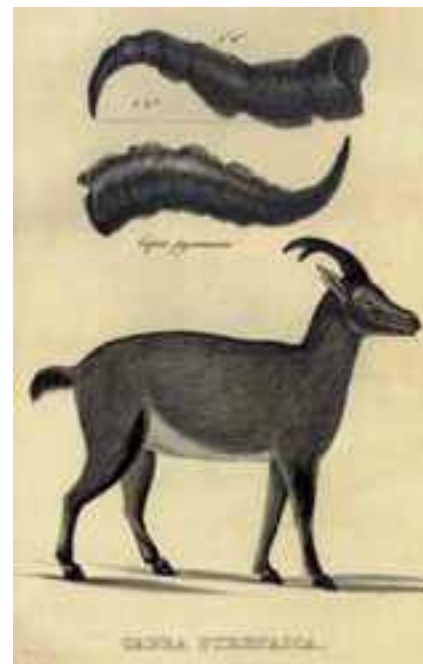
Litografía de hembra bucardo y de cuernos publicada por Schinz en 1838

“5. la cabra del Pirineo. Capra pyrenaica . En el Pirineo español, en las montañas de la Sierra de Ronda y en el Reinado de Granada”.